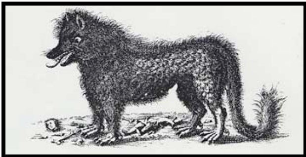
Gravures du 18 ème siècle