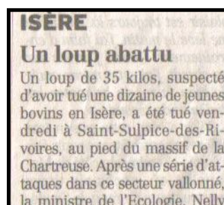
Figaro du 3 et 4 septembre 2005

Imagine à ton tour un court article qu'un journaliste aurait pu écrire pour relater la mort du loup de la pièce de Joël Pommerat.