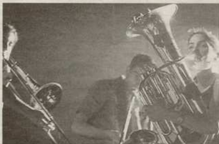
Le public sera assis pour mieux les écouter

Places assises. Les plus jeunes de ceux qui aiment ces Ogres sont restés sur leur fûim lorsqu'ils ont appris la nouvelle lubie de leur groupe fétiche : une tournée uniquement dans des salles assises. « C'est un changement radical... pour quelque temps. On nous considérait de plus en plus comme un groupe festif. C'est