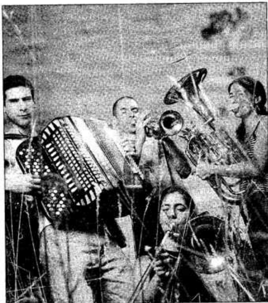
Les Ogres de Barback, c'est déjà dix ans de carrière.

Ils sont tous multi instrumentalistes : cuivres, violon, contrebasse