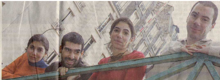
Cette famille d'Ogres incarne depuis plus de dix ans un idéal de faubourg parisien.

Ainsi, ils ont sorti récemment La Pittoresque Histoire de Pitt Ocha , disque pour enfants avec la complicité de Pierre Perret, La Tordue, Tryo, La Rue Ketanou, K2R Riddim... Hors de toute habitude de contrats soignés et de featuring pesés au trebuchet : « On a