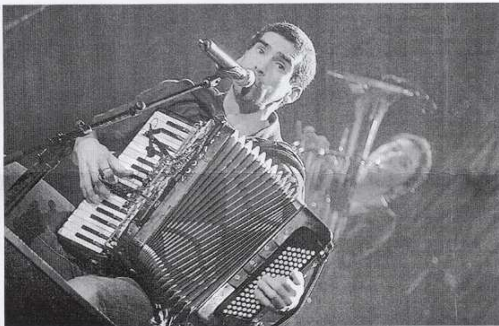
Samedi, les Ogres de Barback ont fait entendre leurs textes au public et privilégier l'intimité.

Leurs influences sont tantôt tziganes, bal musette, slaves, voire rock, quand la guitare électrique s'en mêle. De l'accordéon à la soie musicale, en passant par la flûte traversière, la clarinette, le piano ou la contrebasse, il y en a vraiment pour tous les goûts ! Mais comment font-ils ? Ils ne sont pourtant que quatre ! Simple : ils ont la bougeotte et savent jouer de tout. La part belle est accordée aux très nombreux cuivres qui donnent des airs de fanfare étincelante à l'ensemble. Et le