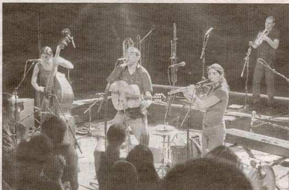
SANNOIS, MARDI SOIR. Deux concerts à l'espace Michel-Berger et un album live à venir : la nouvelle étape d'une histoire de famille aux allures de conte de fées commencée en 1994.

Boulimiques, les quatre multi-instrumentistes ne cessent jamais de travailler, trouvant le temps d'enregistrer sept albums entre deux tournées aux quatre coins de l'Europe (plus de 1000 concerts au compteur). Jouant complètement l'auto production, les fondateurs du label Irfan qui emploie 8 personnes s'inscrivent dans une démarche origi-