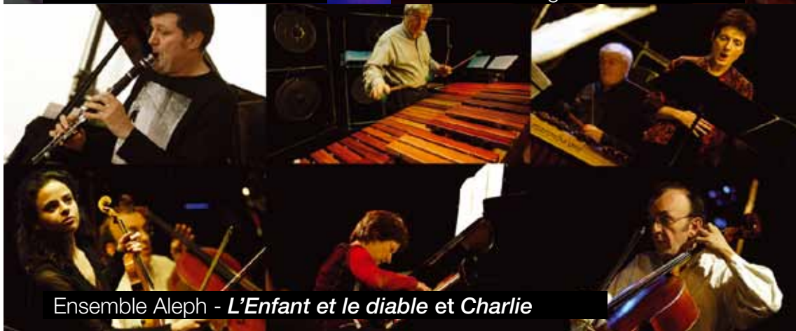
Ensemble Aleph - L'Enfant et le diable et Charlie

du 18 au 20 mars à la Scène nationale de Sénart