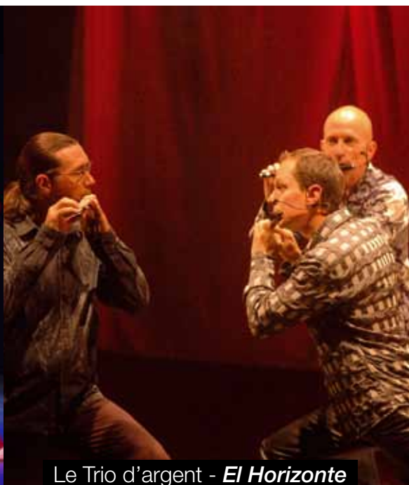
Le Trio d'argent - El Horizonte